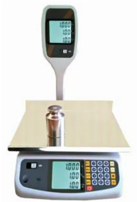
Με Πύργο (LF)